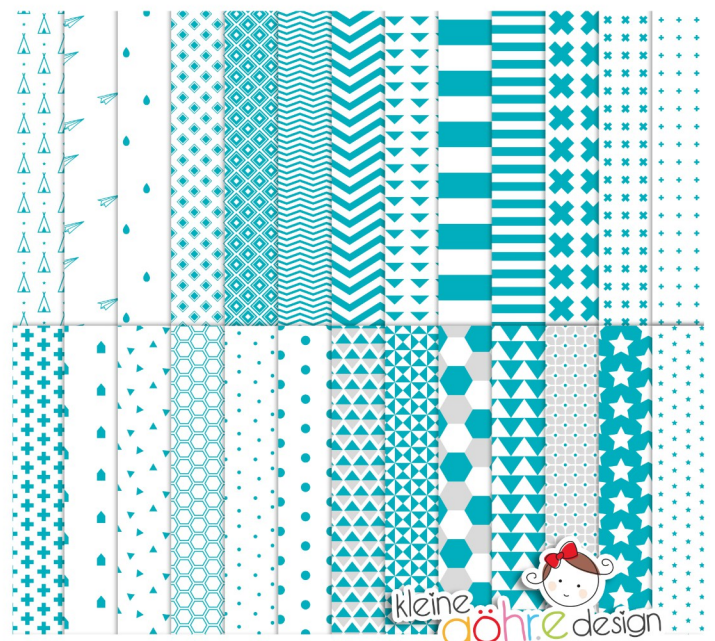
digitale Papiere "Baby's Sprüche türkis"