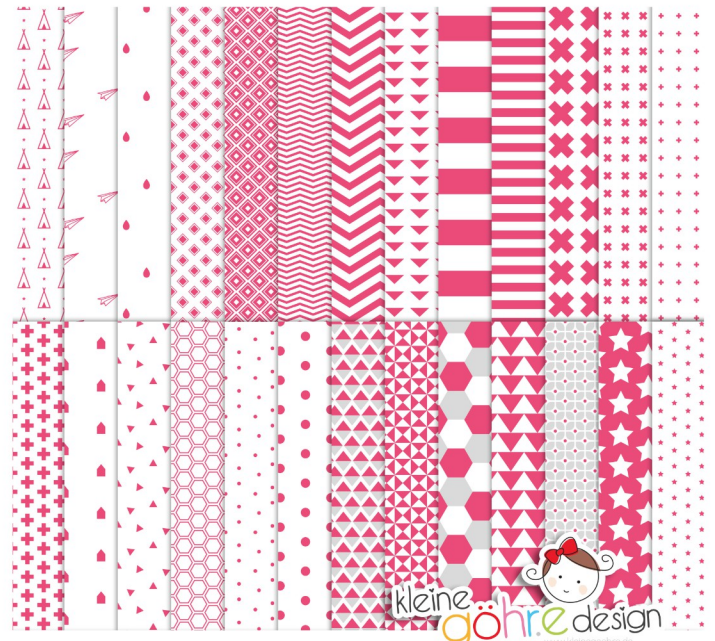
digitale Papiere "Baby's Sprüche pink"